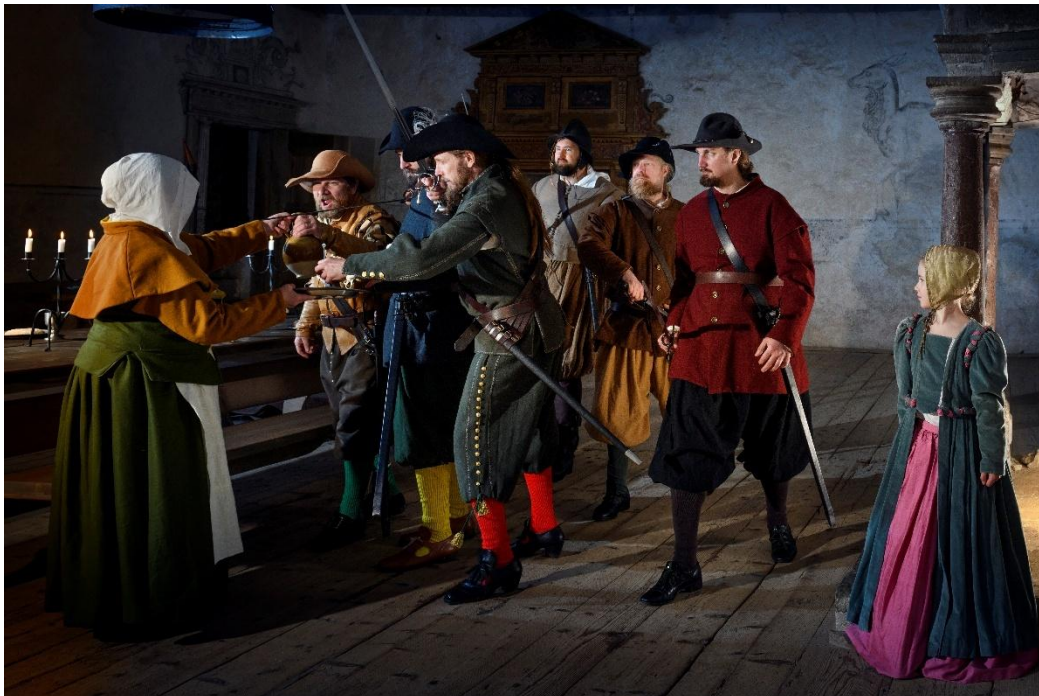
Danskar stormar in i bagarstugan. Iscensättning i Torpa stenhus.