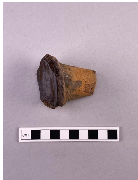
Föremål 8. Ben till trebensgrytor, som användes för matlagning. Trebensgrytor av rödgods var vanliga under 1500- och 1600-talet. De är de vanligaste kärlen som arkeologerna har hittat på Gullberg. De flesta tillverkades i Sverige, men några var importerade, främst från Nederländerna och Tyskland.