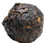
Föremål 3. Druvhagel från sent 1500-tal. Drygt 3 cm i diameter.