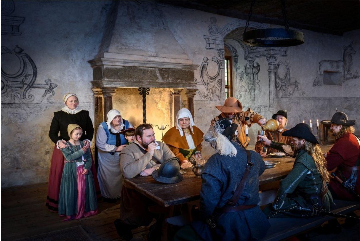
Hungriga soldater.