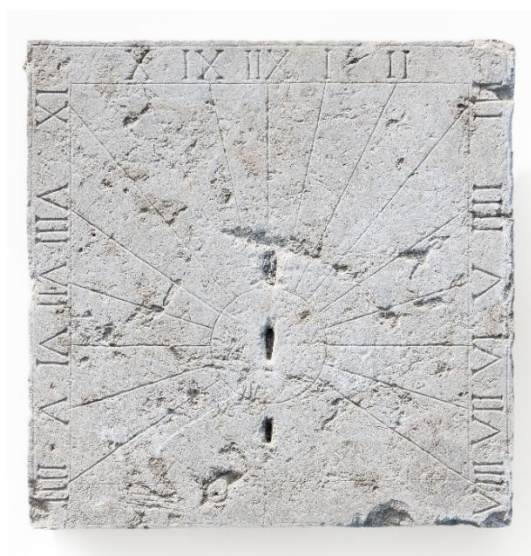
Föremål 12. Solur av kalksten.

Pekaren på soluret bör ha varit riktad mot norr. När solen sken, föll pekarens skugga på någon av siffrorna på stenplattan. Det är romerska siffror, som visade klockslaget från fyra på morgonen till åtta på kvällen. Nackdelen var att soluret inte fungerade när det var mulet!