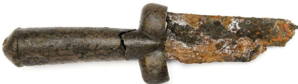
Föremål 4. Testikeldolk från mitten av 1400-talet.