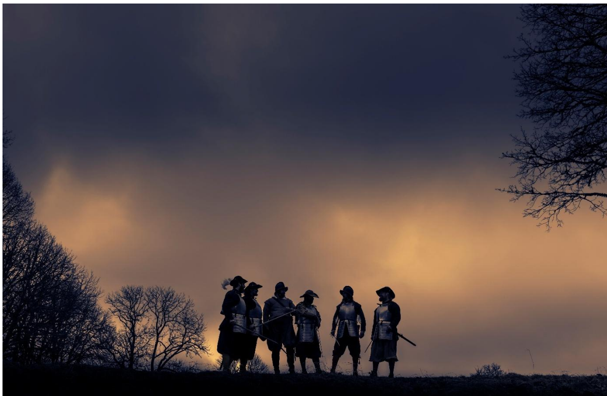
Danska soldater.

De arkeologiska utgrävningarna har gett ny kunskap om både strid och vardag på Gullberget. I 3D-modellen på skärmen, eller med en QR-kod, kan du utforska fästningen som den såg ut år 1611, virtuellt rekonstruerad med hjälp av kunskaperna från utgrävningen!