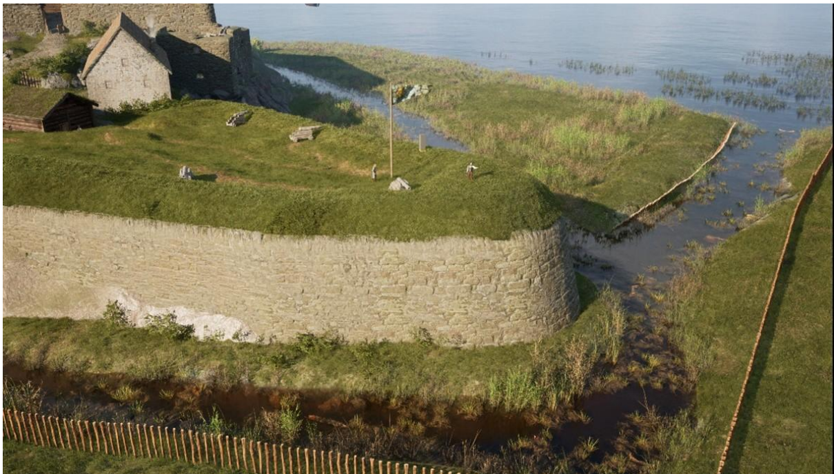
Rekonstruerad bastion från Gullbergs fäste.

Utställningen kommer att visas till januari 2026. PDF:en finns för nedladdning på Historiska museets hemsida.