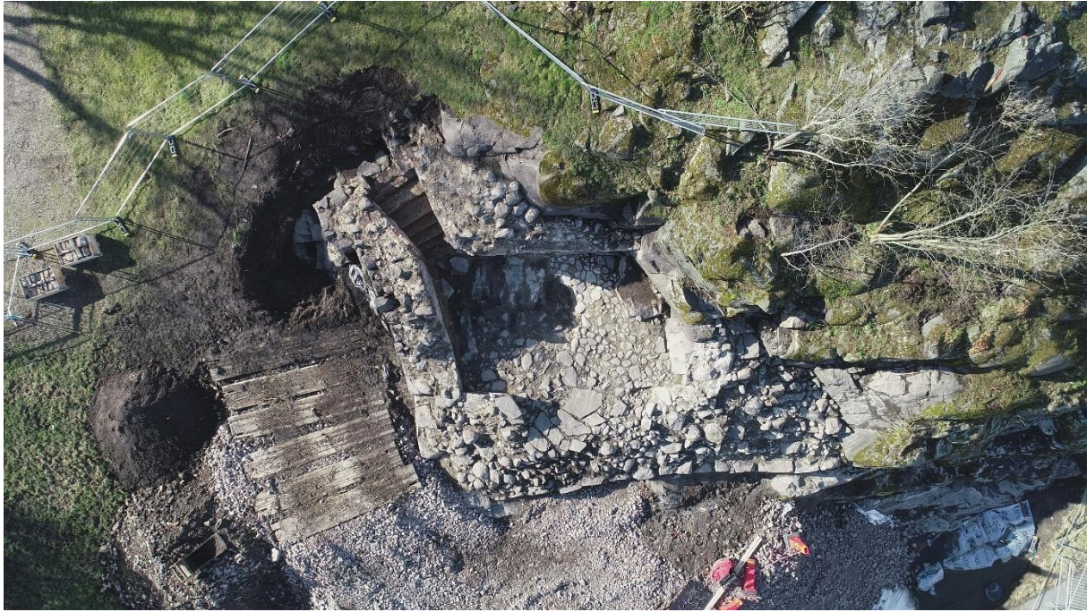
Trappan till källaren under utgrävningen.