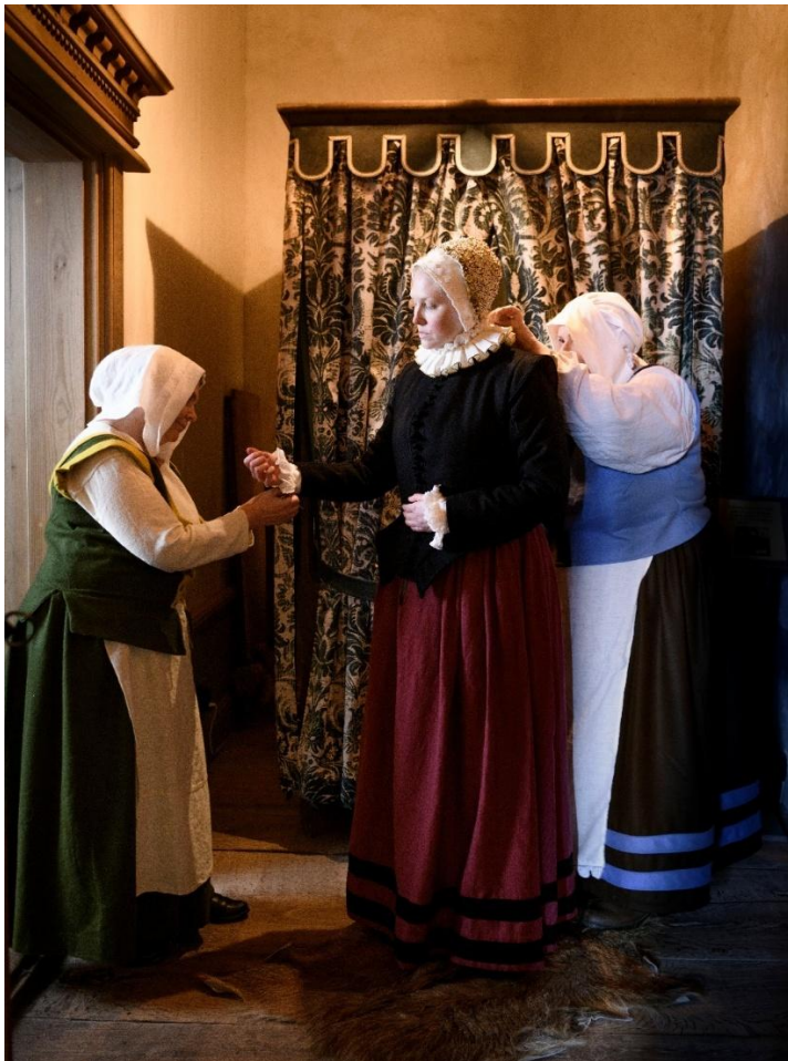
En del av fästets invånare var kvinnor och barn.

Vi vet dock inte hur många kvinnor och barn som bodde i fästet, eftersom soldaternas familjer inte finns med i registren.