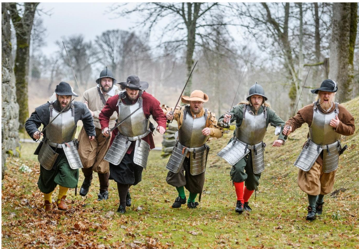
Dansken anfaller.