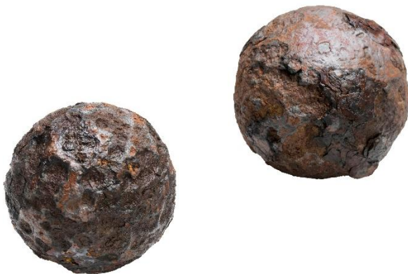
Föremål 2. Kanonkolor av järn från sent 1500-tal. Cirka sex cm i diameter.