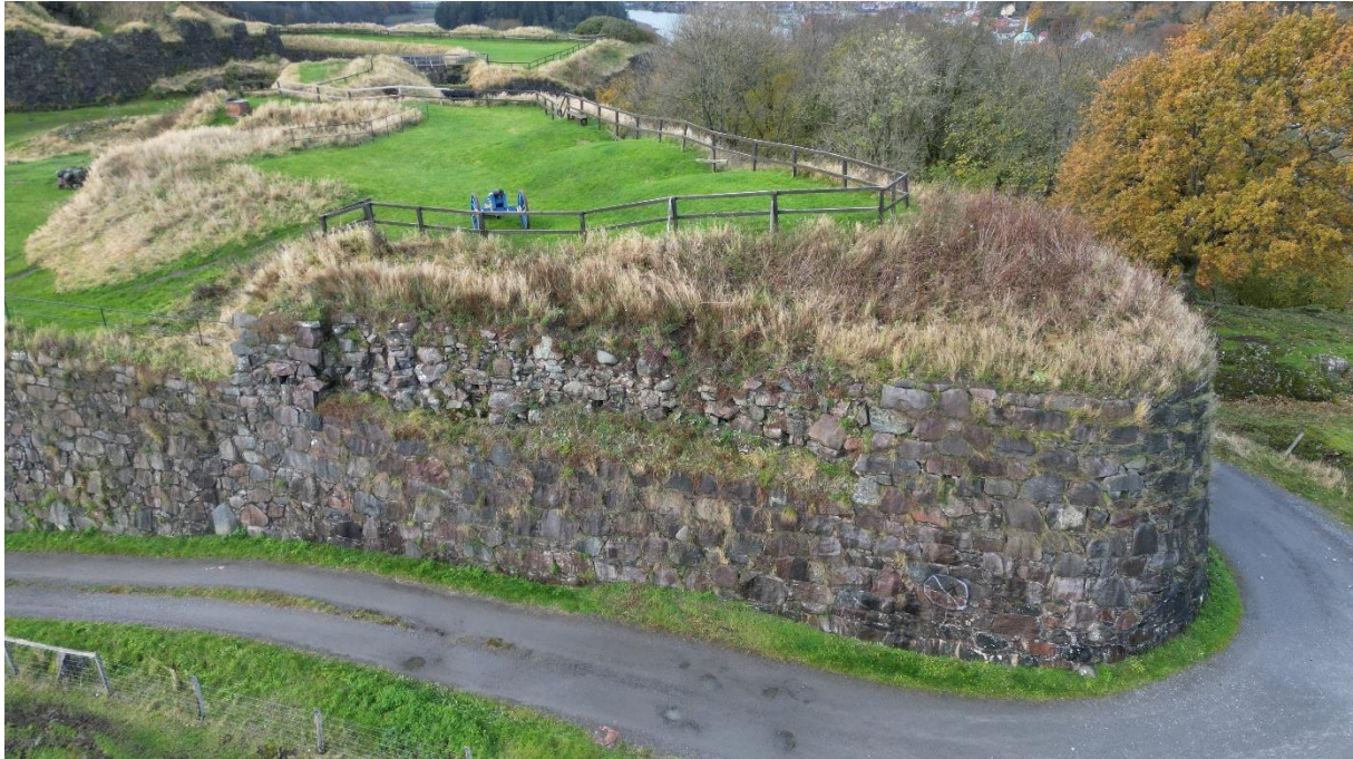
Bastion i Bohus fästning.