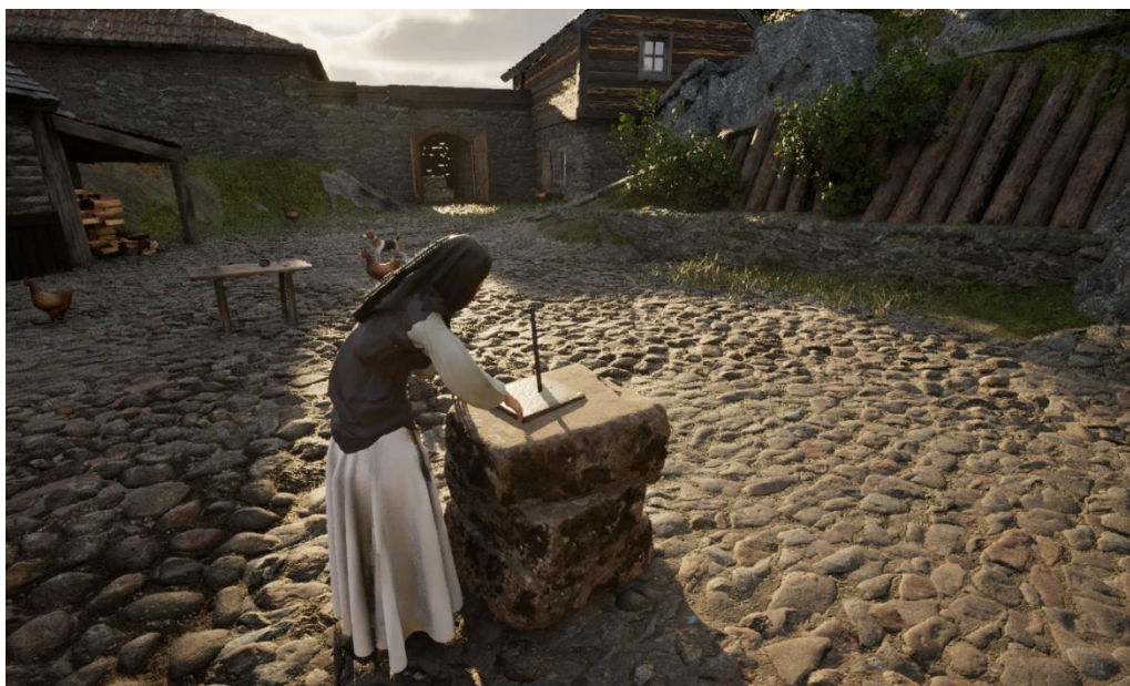
Stillbild ur film som visar hur soluret fungerar.