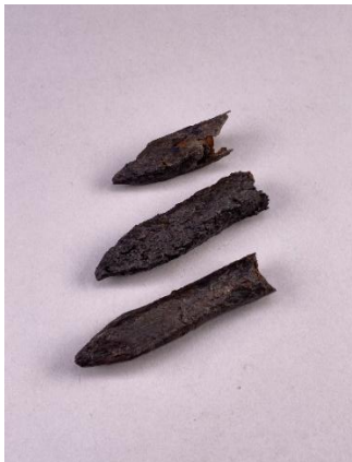
Föremål 1. Pilspetsar till armborst, från mitten av 1400-talet.