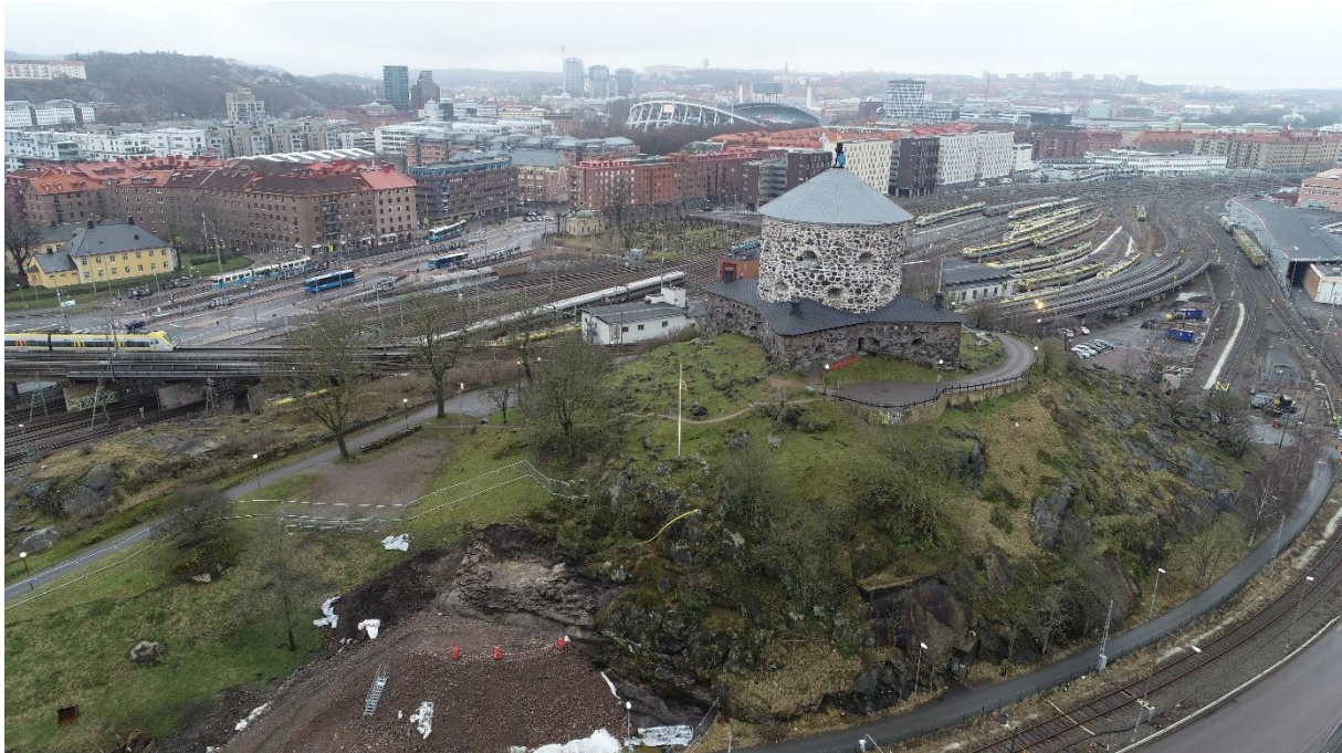
Flygfoto över Skansen Lejonet mot söder. De arkeologiska undersökningarna syns nere i vänstra hörnet.