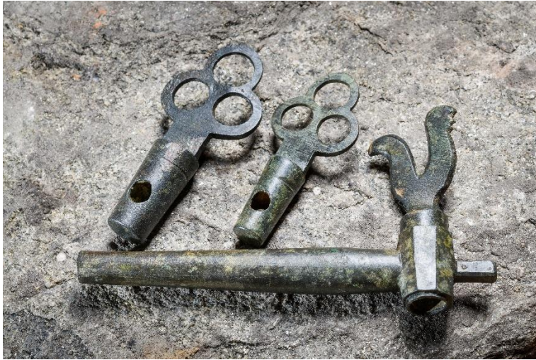
Föremål 6–7. Kranar till öltunnor. Kranen med tuppformat vred kallas för ölhane. Kranarna reglerade flödet av öl genom en tapp från tunnan. De är gjorda av kopparlegering och daterade till sent 1500-talet.