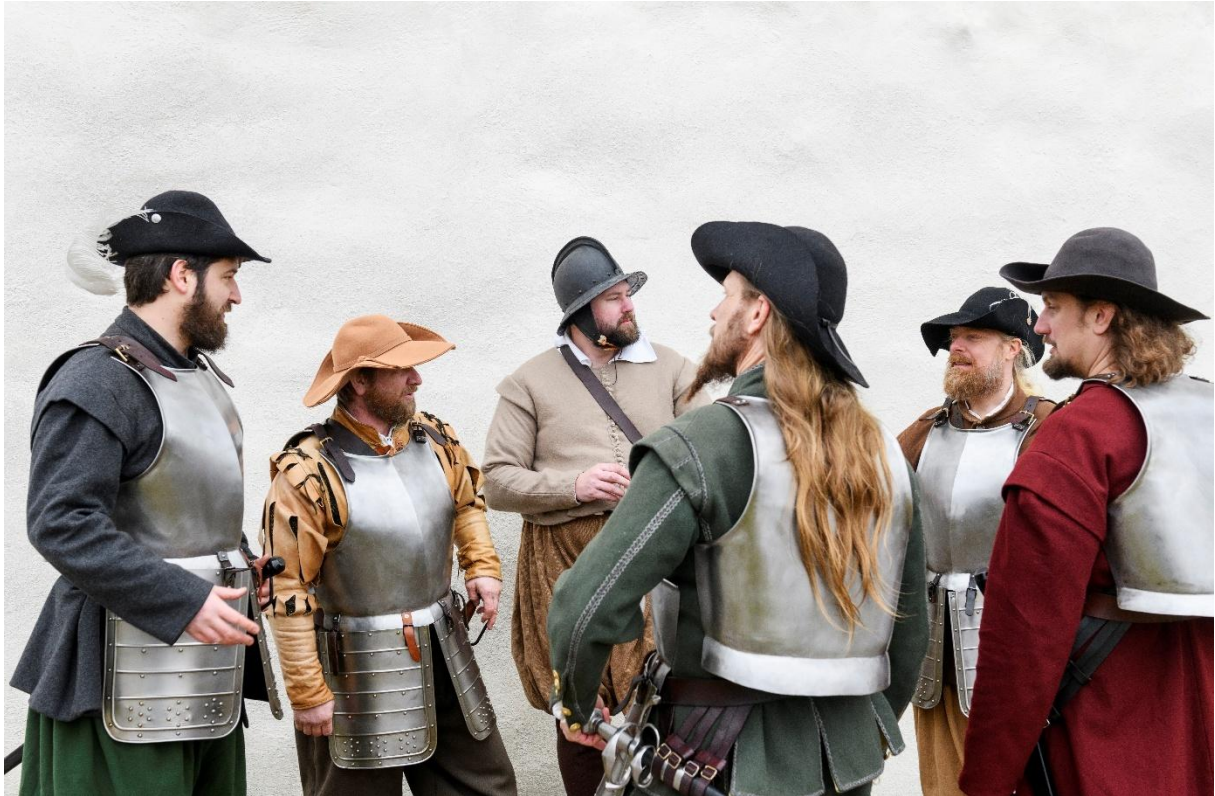
Iscensättning av soldater.