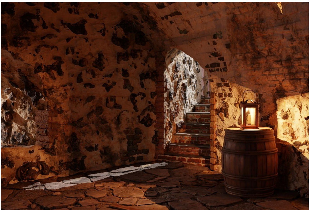
Källaren och trappan rekonstruerade.