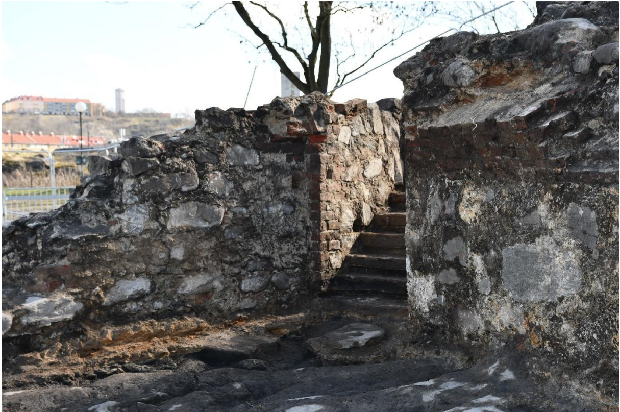
Trappan till källaren under utgrävningen.