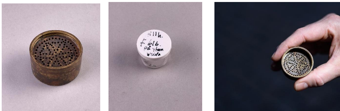
Föremål 9. Sandströare samt en liten behållare med den sand som hittades inuti sandströaren. Sandströaren i en hand.

Nyckeln (11) kan ha hört till en dörr eller använts för att förvara ägodelar eller ammunition på ett säkert sätt.