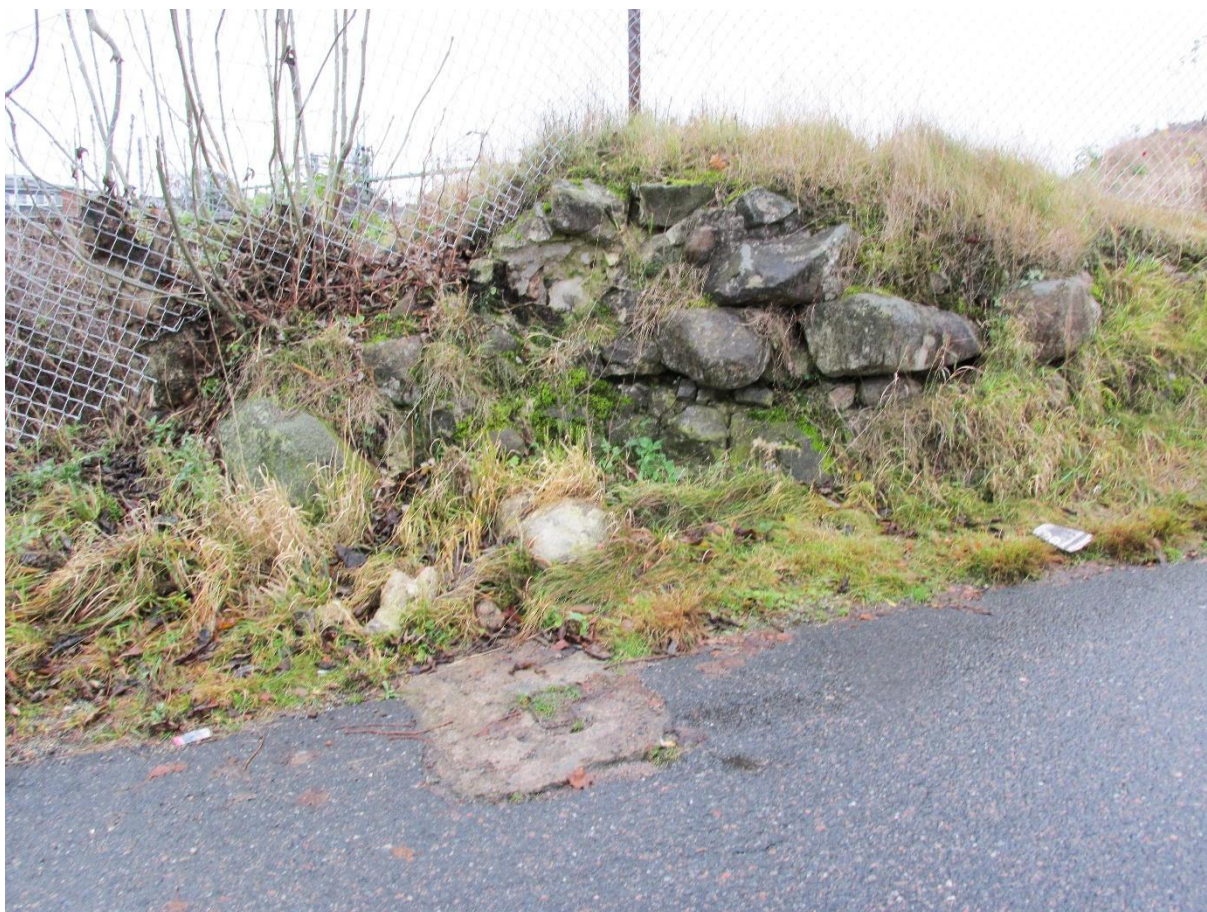
Den som besöker Gullberget kan se rester av de äldre murarna.

För den som vill läsa mer om Gullberg och de arkeologiska utgrävningarna, finns flera artiklar och snart en rapport. Föremålen från undersökningarna kommer att förvaras på Göteborgs stadsmuseum.