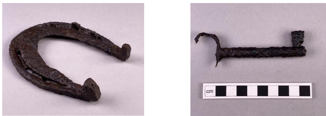
Föremål 10–11. Hästsko av järn och nyckel till en dörr eller större kista från sent 1500-tal. Foto: Helena Rosengren/SHM (CC BY).