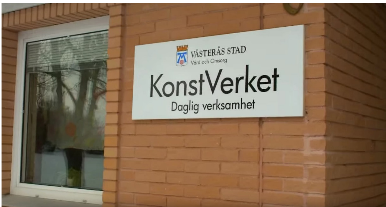
Bild 4 Konstverket Daglig verksamhet

⑥ Visa fotografiet på en skylt "Konstverket Daglig verksamhet". Ge inte eleverna någon bakgrundsinformation.