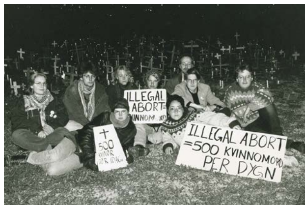
Bild 7 Abortdemonstration i form av en likvaka utanför Livets ord i Uppsala. 25 maj 1994.