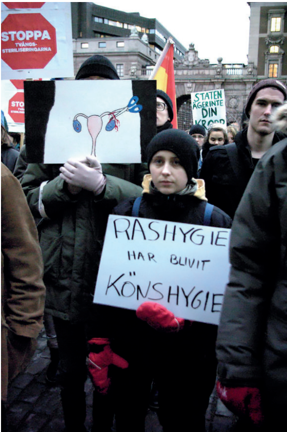
Bild 2 Manifestation mot tvångssteriliseringar utanför riksdagen i Stockholm. Januari 2012.

⑥ Fyll på med kunskap från kunskapsruta 2, bild 2.