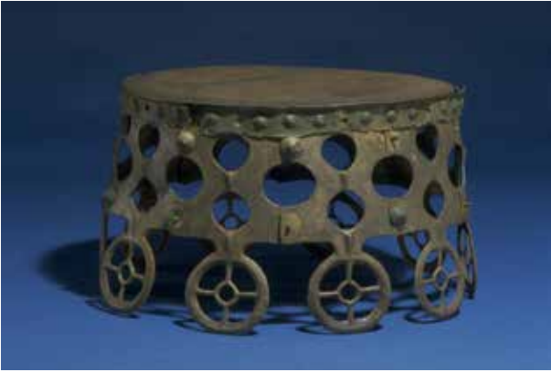
En astronomisk modell från östeuropa.