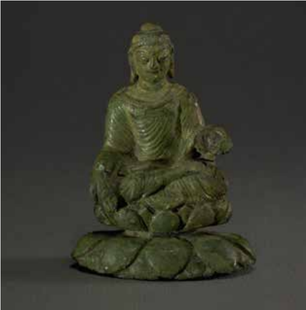
Buddhan från Helgö.