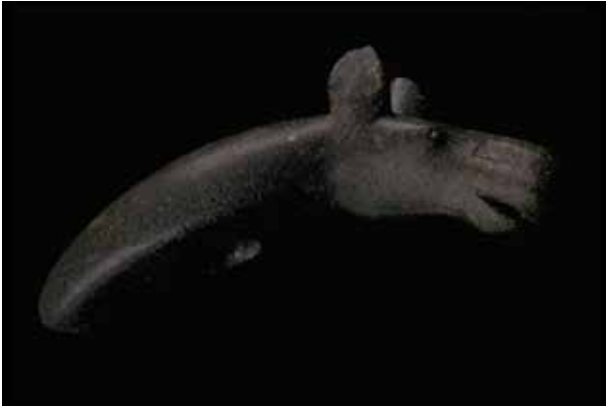
Älg från Karelen.