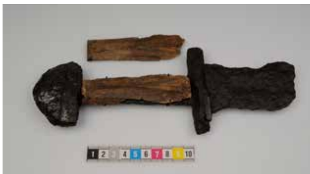
Svärdet från Röstahammar. Historiska museet.