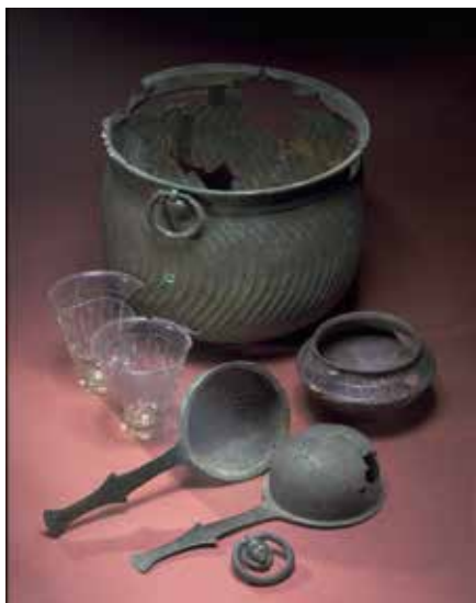
En servis från romarriket.