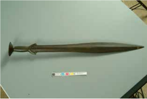
Svärd från sydöstra Europa.