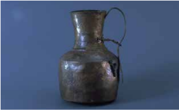
Bronskanna från härskarinnan av Ölands grav.