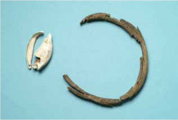
Kaurisnäcka och elfenbensring.