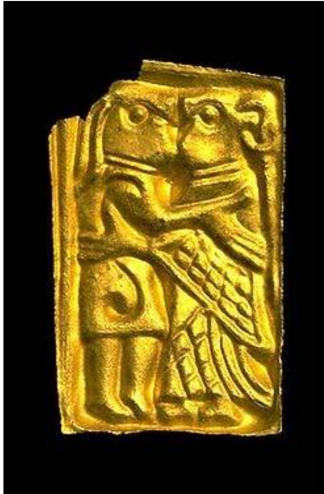
"Guldgubbe" (400–500-tal e Kr) från Helgö i Uppland