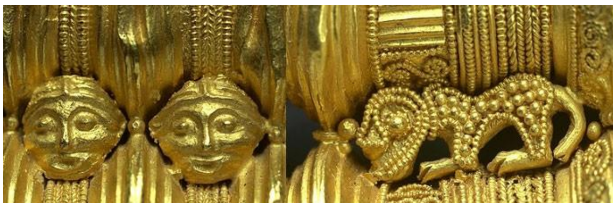
Detaljer från halskragen funnen i Ålleberg.